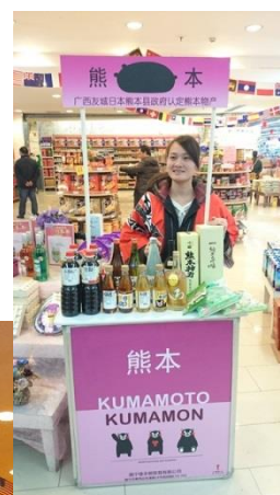
(デモンストレーション台)

1995年創立。南寧市の4店舗をはじめ広西に10店舗を運営する広西有数の百貨店。店舗総床面積は20万㎡。総従業員数1万人以上。広西はじめ国内外のVIP、富裕層、観光客も多く来店。